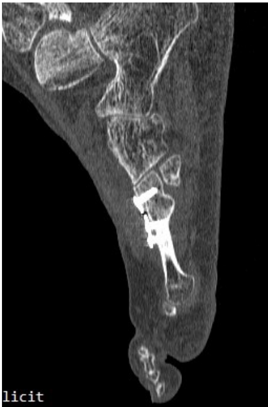
Imagen 6. TAC postoperatorio a los 5 meses. 6A. Imagen del 2º metatarsiano que muestra integración del injerto con la placa dorsal. 6B. Imagen del 4º metatarsiano que muestra consolidación del 4º metatarsiano.

postoperatorios) se realizó última visita de la paciente encontrándose esta en perfectas condiciones y dando el alta a la paciente. La paciente ha sido seguida posteriormente con revisiones anuales durante 4 años (hasta 2019) sin ninguna alteración.