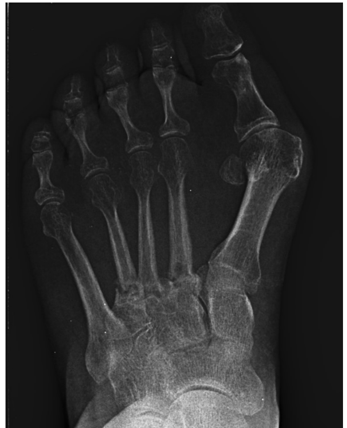
Figura 1. Radiograf3a dorso-plantar en carga del pie derecho. Se evidencia la ausencia de consolidaci3n de las osteotom3as en las bases de 2.º, 3.º y 4.º metatarsianos despu3s de 9 meses de la intervenci3n inicial.

Se realiz3 radiograf3a dorso-plantar en carga del pie derecho (Figura 1) que mostraba una imagen radiol3gica compatible con ausencia de consolidaci3n de las osteotom3as en las bases de 2.º, 3.º y 4.º metatarsianos, adem3s de la presencia de hallux abductus valgus. Se solici3 una tomograf3a axial computarizada (TAC) para estudiar m3s detenidamente el estado actual del proceso de consolidaci3n 3sea. La paciente acudi3 con resultado de TAC el 5 de mayo de 2015, donde se evidenci3 la ausencia completa de consolidaci3n 3sea en segundo metatarsiano (Figuras 2A y 2B), consolidaci3n pr3cticamente completa de tercer metatarsiano (Figura 2C) y la presencia de callo 3seo con consolidaci3n incompleta en el cuarto metatarsiano (Figura 2D).