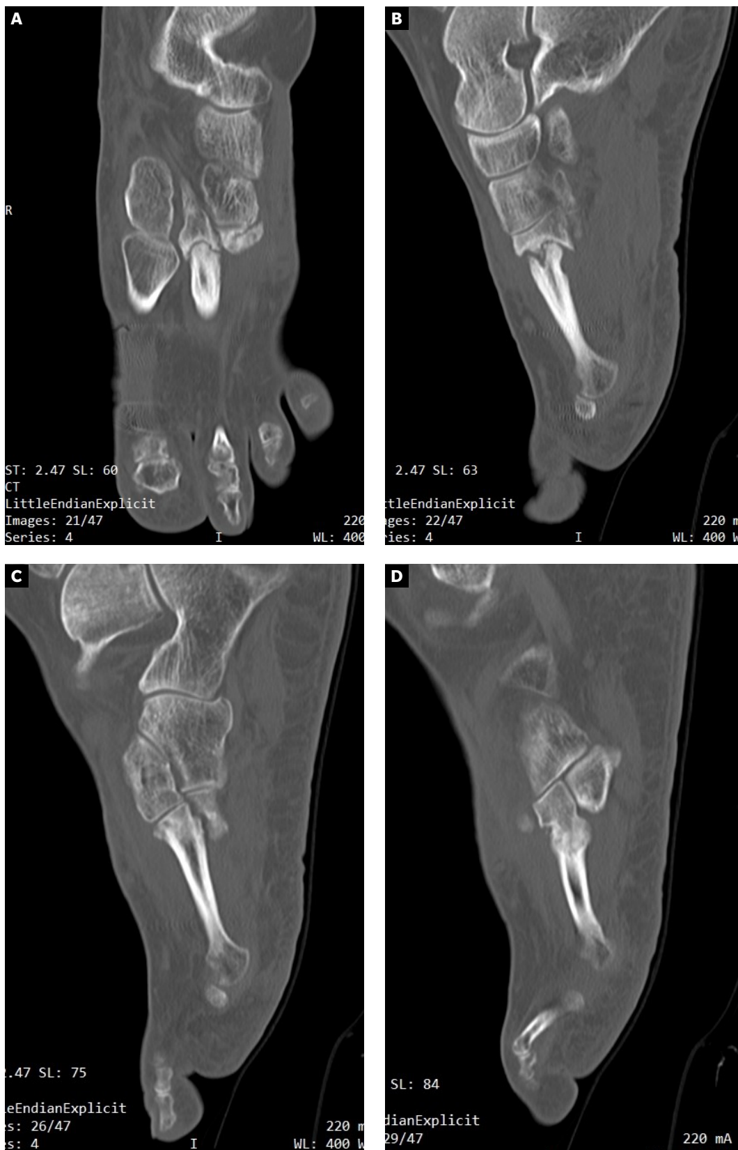
Figura 2. A y B: ausencia de consolidación completa en 2.º metatarsiano compatible con no-uni3n y pseudoartrosis. C: consolidaci3n completa en 3.º metatarsiano. D: no-uni3n con consolidaci3n incompleta del 4.º metatarsiano.