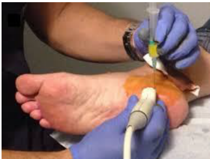
Figura 1. Punto de punción medial para la infiltración de colágeno.