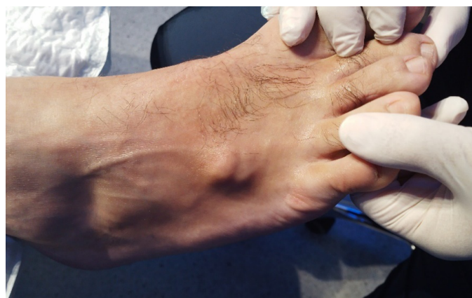
Figura 1. Imagen clínica.

La ecografía musculoesquelética (Figura 2) reveló imagen polinodular hipoecoica, homogénea, con refuerzo acústico posterior,