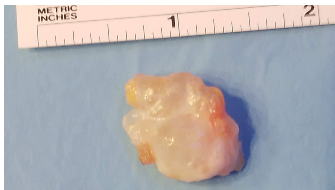
Figura 3. Imagen intraoperatoria.