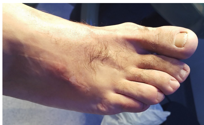
Figura 4. Imagen posquirúrgica al año.

casual hasta lesiones dolorosas, limitantes o incluso responsables de fenómenos compresivos sobre estructuras óseas y nerviosas 13,14 .