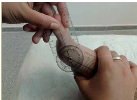
Figura 1. Técnica de medición de la extensión de la primera AMTF en descarga.

Para la recogida de datos, en primer lugar se registraba el rango de extensión de la primera AMTF (figura 1).