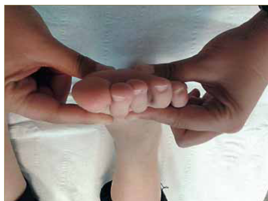
Figura 6. Técnica de exploración de la movilidad del primer radio.

Para el análisis estadístico de los datos se empleó el paquete estadístico SPSS versión 22.0 para Windows 7. Se realizó un análisis descriptivo de todas las variables recopiladas. Una vez comprobada la distribución normal o no normal de las variables mediante la prueba de Shapiro-Wilk, se realizaron comparaciones y correlaciones con pruebas paramétricas (test de la t de Student para muestras relacionadas para las comparaciones, y coeficiente de correlación de Pearson para las correlaciones) o no paramétricas (test de Wilcoxon para las comparaciones, y rho de Spearman para las correlaciones), según correspondiese. Se comparó la altura del arco longitudinal interno (ALI) con extensión y sin extensión del hallux, la PRCA con el hallux neutro y en extensión máxima, y la extensión máxima del hallux en descarga y en carga. Se estudió la correlación de las siguientes variables: extensión máxima del hallux en carga, altura máxima del ALI y PRCA con extensión máxima del hallux, por un lado. También se correlacionó la extensión del hallux en descarga, la extensión del hallux en carga sin plan-