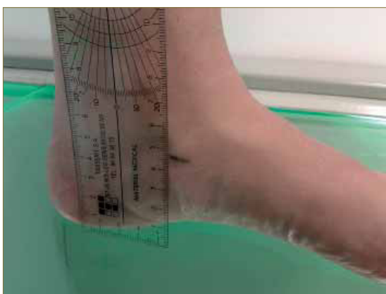
Figura 3. Técnica de medición de la altura del escafoides en carga con hallux neutro.