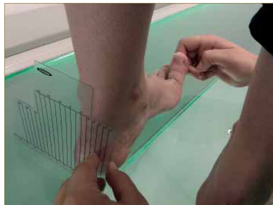
Figura 5. Técnica de medición de la PRCA con extensión máxima del hallux.