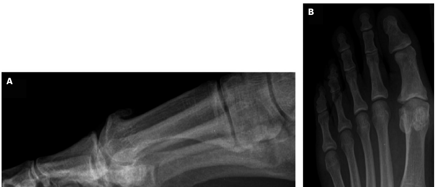
Figura 1. A: radiografía lateral estándar en carga que muestra osteofitos dorsales metatarsofalángicos. B: radiografía anteroposterior con evidencia de estrechamiento del espacio articular 2 .

En el manejo del HR, se distinguen dos enfoques: conservador y quirúrgico. El tratamiento conservador se reserva para los grados iniciales de la clasificación de Coughlin, mientras que el quirúrgico se aplica en grados más avanzados. En el enfoque conservador, se considera la manipulación bajo anestésicos locales e inyecciones intrarticulares de esteroides para romper adherencias capsulares, aliviando la contractura en flexión observada en el HR. Estudios han informado 3 mejoría del dolor y alivio sintomático durante 6 meses postratamiento, con alrededor de un tercio de los pacientes eventualmente requiriendo cirugía.