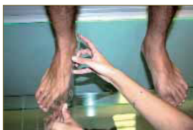
Figura 6 y 7. Formas posibles de colocar al paciente para valorar la 1ª AMTF en carga.

Referente a esta maniobra exploratoria en carga, existen dos maneras de realizarlas. Una de ellas se realiza con el paciente en estática y la otra es en bipedestación simulando la marcha con el pie a medir por delante del otro. (Figura 6 y 7).