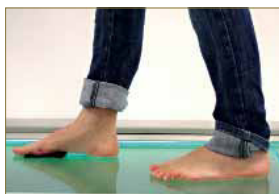
Figura 5. Deslizaremos el miembro inferior a valorar hacia adelante para simular con mayor exactitud "el paso" durante la marcha.

Referente a esta maniobra exploratoria en carga, existen dos maneras de realizarlas. Una de ellas se realiza con el paciente en estática y la otra es en bipedestación simulando la marcha con el pie a medir por delante del otro. (Figura 6 y 7).