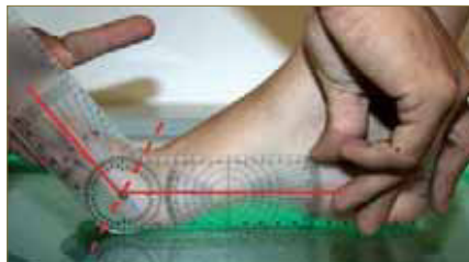
Figura 8. Medición de la primera articulación metatarsofalángica, según Palladino.

En lugar de tomar como referencia la bisectriz del primer metatarsiano, establece como puntos referencia la bisectriz de la falange proximal y la superficie de apoyo (el suelo). Dicho autor afirma que de este modo evitamos que se produzcan deslizamientos de la piel durante la medición, impidiendo que los resultados obtenidos sean erróneos 19 . (Figura 6).