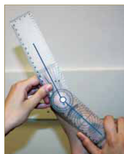
Figura 1. Colocación del Goniómetro de dos ramas en el punto de partida para una correcta medición del rango articular de la primera articulación metatarsofalángica en descarga.

Desde la posición relajada se lleva el dedo junto con la rama distal del goniómetro hacia la máxima extensión, permitiendo que el primer radio se plantarflexione para que el movimiento de extensión se produzca en su totalidad 18, 19, 22 . (Figura 2).