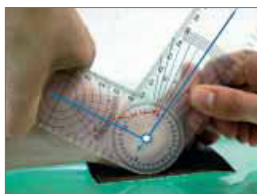
Figura 4. Se aplicará fuerza a nivel de la falange proximal del hallux para evitar compensaciones y mediciones erróneas como consecuencia de la hiperextensión de algunas falanges distales.

Para este tipo de medición es recomendable el uso de una superficie rugosa (papel de lija fina) bajo la cabeza del primer metatarsiano para evitar deslizamientos indeseados del pie y sobre todo de la 1ª AMTF 26 . (Figura 5).